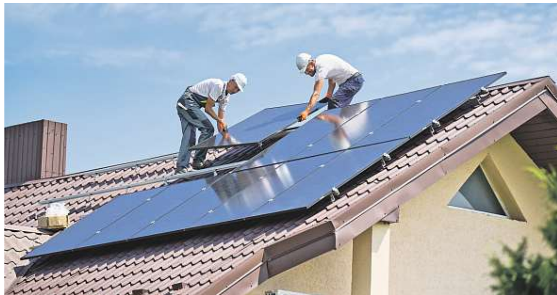
Solární boom je minulostí. Firmy propouštějí a zaměřují se více na zákazníky z řad firem.

Útlum poptávky je vidět zejména u domácností, u firemní fotovoltaiky je pokles menší. Za polovinu letošního roku vzniklo 2160 nových firemních fotovoltaik, což je meziročně asi o čtvrtinu méně. Podstatně však narostla průměrná velikost solárních elektráren, které si firemní klienti nechávají instalovat – z 54 kW na 118 kW. „Trh se konsoliduje a hodně firem se nyní začíná orientovat